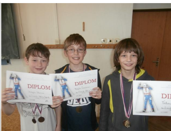
Chlapci 5.-9. třída