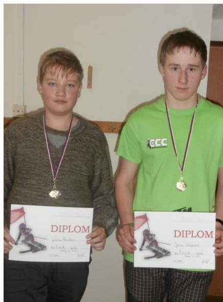
Chlapci 6.-9. třída