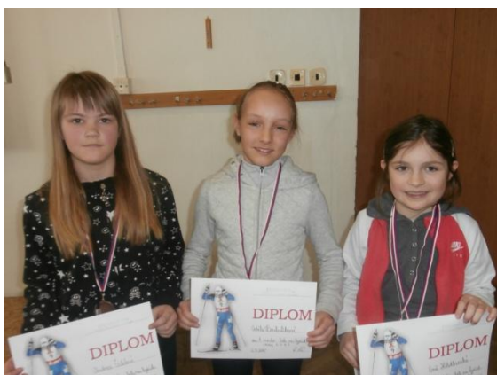
Dívky 3.-4. třída