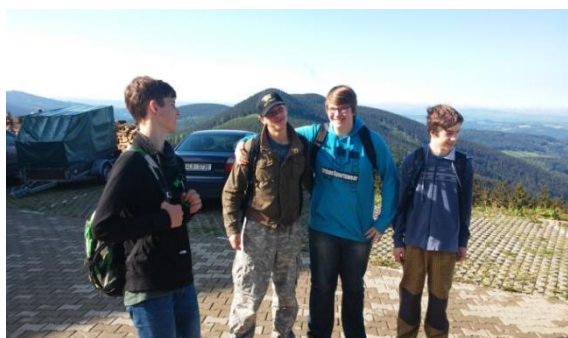
Deštníky jsme měli pořád...