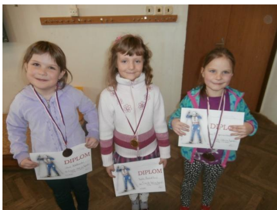
Dívky 1.-2. třída