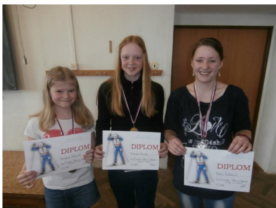
Dívky 5.-9. třída