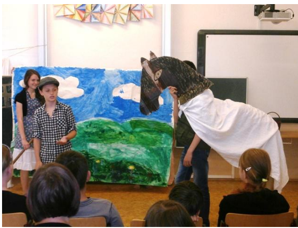
Jak se sedlák ženíl s kobyllou