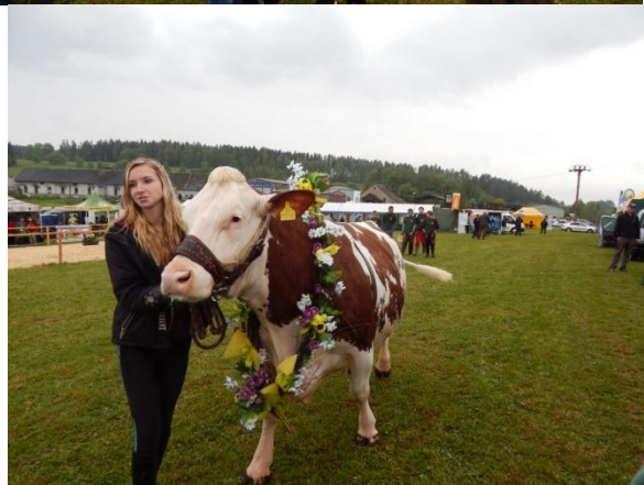
Miss sympatie z minulého roku (ta vpravo)