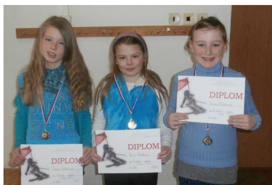
Dívky 3.-5. třída