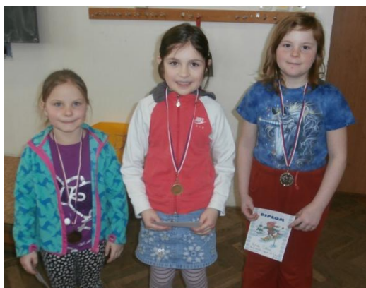
Dívky 1.-3. třída