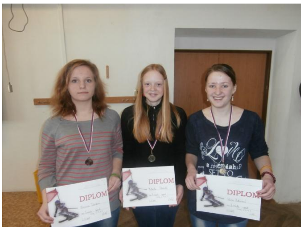
Dívky 6.-9. třída