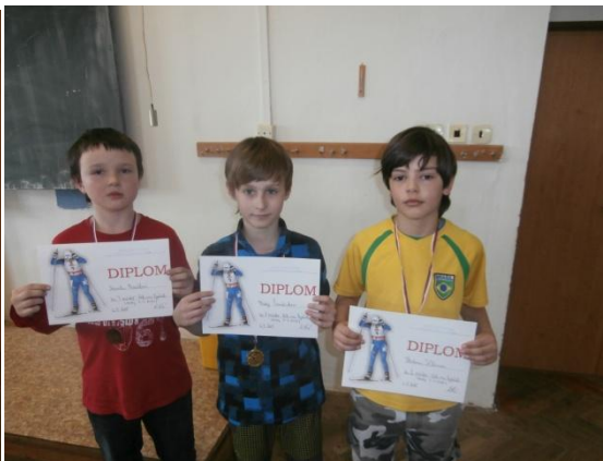
Chlapci 3.-4. třída