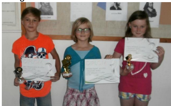
Kategorie 2. -4. třída