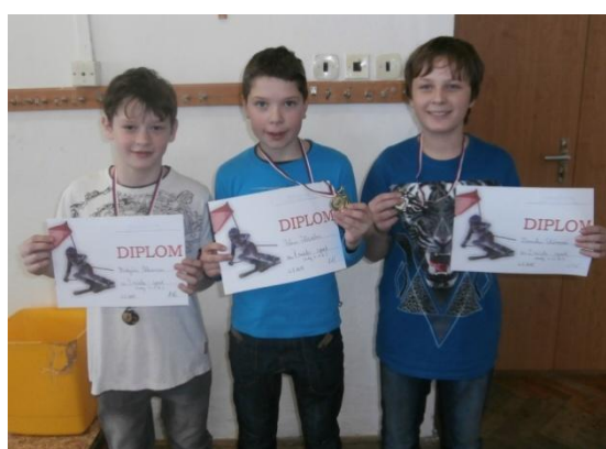
Chlapci 4.-5. Třída