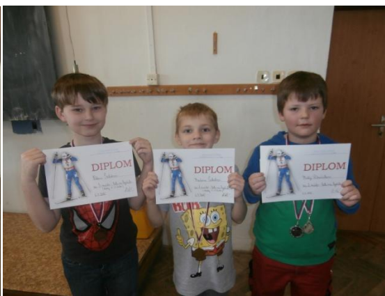
Chlapci 1.-2. třída